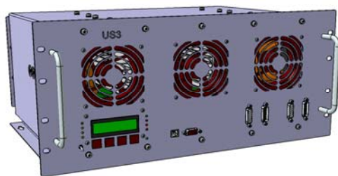
Рис. 3. Внешний вид источника бесперебойного питания типа US3

В шкафу SOT-01-04 используется источник бесперебойного питания типа US3. Внешний вид ИБП показан на рисунке 3.