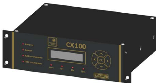
Рис. 4 Внешний вид контроллера PREMKO™ CX100.

Контроллер имеет ЖКИ дисплей, который отображает его текущее состояние. В случае выхода за пределы нормы контролируемых параметров или поступления команд на дискретные входы, информация о текущем событии индицируется на дисплее. Внешний вид контроллера с кнопками управления приведен на рис. 4.