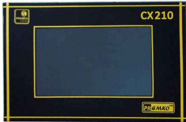
Рис. 1. Внешний вид устройства.

3.2.1. Устройство выполнено в металлическом прямоугольном корпусе (рис. 1) который состоит из двух частей. Поверхность деталей из нестойких к коррозии материалов имеет защитное покрытие в соответствии с ГОСТ 9.303. На лицевой части устройства находится информационный дисплей отображающий мнемосхему. Клеммные зажимы находятся снизу и предназначены для подключения проводников сечением не более 1,5 \text{ мм}^2 . Габаритные размеры устройства и установочные размеры приведены на рисунке 2.